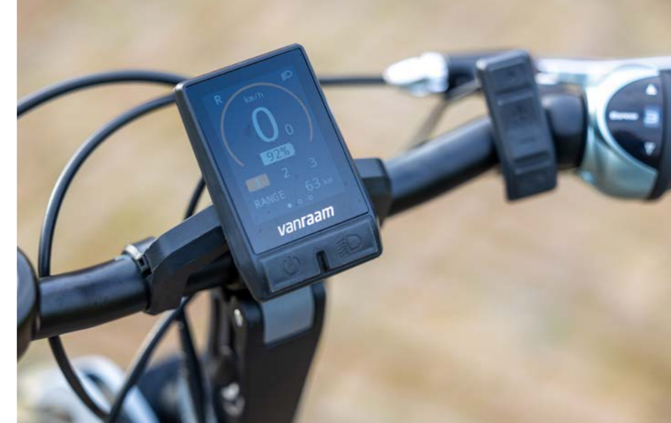
Silent smart display