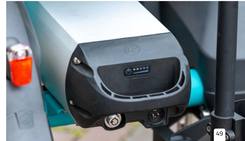
Cube Li-ion accu