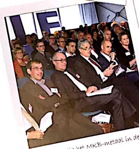
Het event zette het MKB-metaal in de etalage.